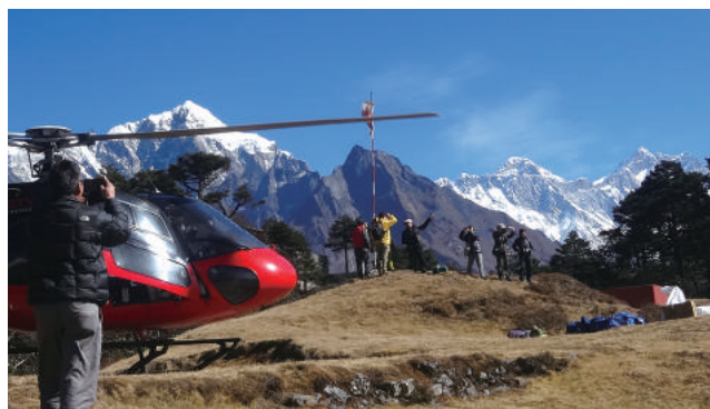
ホテル専属のヘリポートを降りてすぐエベレスト