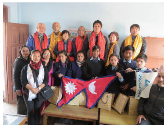
カトマンズの学校にて