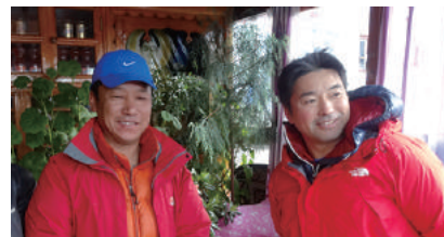
ダヌルさん(左)と豪太さん(右)