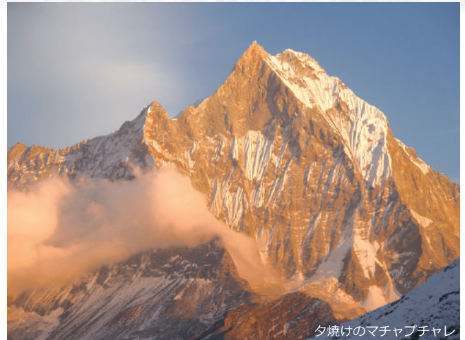
夕焼けのマチャプチャレ