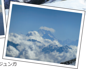
カンチェンジュンガ